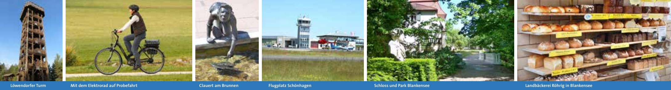
Löwendorfer Turm Mit dem Elektrorad auf Probefahrt Clauert am Brunnen Flugplatz Schönhagen Schloss und Park Blankensee Landbäckerei Röhrig in Blankensee