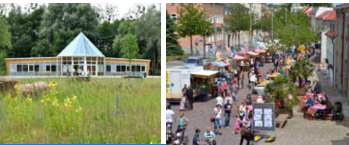
NaturParkZentrum Fest der Generationen Trebbin

Bitte beachten Sie, dass es sich bei dem angegebenen Busfahrplan um einen Richtfahrplan handelt.